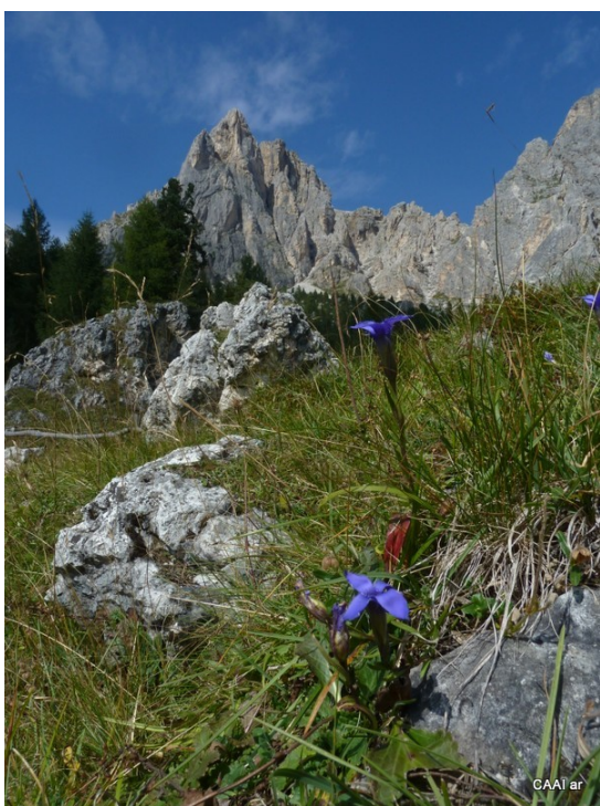
Eine hohe Ethik ist immer mit dem Begriff der Schönheit in Verbindung

Es wäre eine sehr schöne Erfahrung, wenn Verwandte oder Nicht-Teilnehmer, die im Tal oder nahe dem Wandfuß warten, durch ihre wahrnehmende Fähigkeit den Akteuren in der Wand eine intensive Sicherheit bieten könnten. Sie verfolgen die Linie, achten auf die Wetterwechsel, zittern bei Steinschlag und sind um eine gute Rückkehr der Kletterer besorgt. Die menschliche Solidarität, in einer aktiven, wahrnehmenden und unterstützenden Gegenseitigkeit, eröffnet größere Dimensionen gegenüber mancher isoliert angewendeten Technik. Die Ethik der Solidarität, der Selbstwahrnehmung und des Selbstrespekts eröffnet große Dimensionen und wäre eine in der Zukunft zu entwickelnde Dimension. Diese Ethik könnte nicht nur zur Solidarität beitragen, sondern zu einem gegenseitigen Schutz vor Gefahren werden. Es ist nicht nur das Seil, das das Risiko verringert, sondern auch der „Schutzpatron“, also die kreative Ethik, die auf die Ermutigung des Gefährten ausgerichtet ist und die größte und noch nicht entdeckte Dimension der Sicherheit bietet.