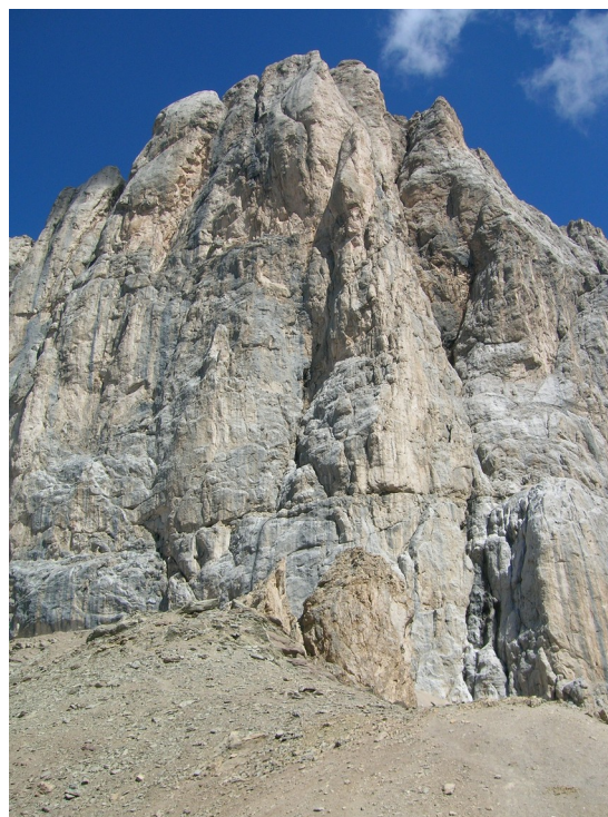
Marmolada - Punta Penia: Über den linken Pfeiler führt die Route von Maffei/Frizzera, durch die zentrale Zone die Via Soldà und rechts über den Südpfeiler die Via Micheluzzi - drei berühmte, klassische und ästhetische Routen